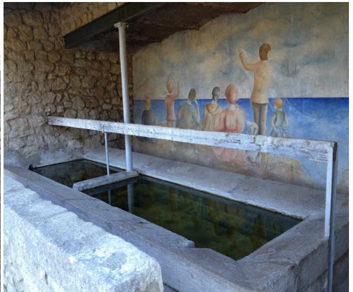
Le lavoir du Beucet