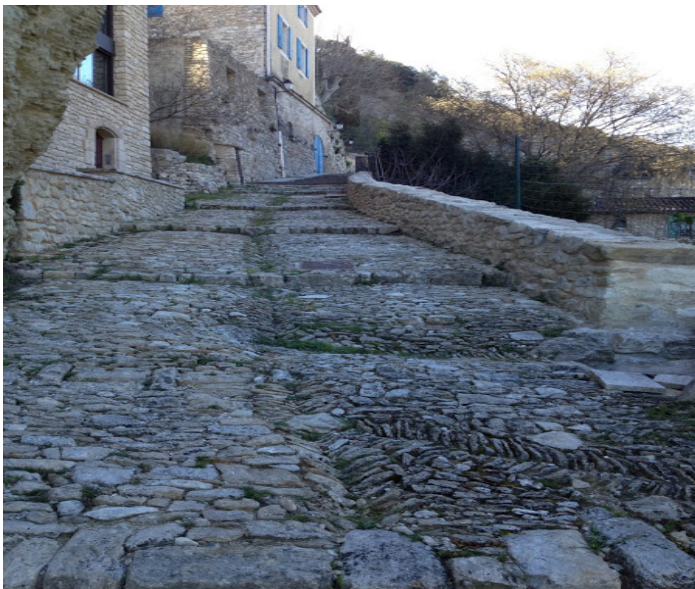
Une ruelle du Beucet