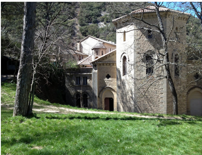
Ermitage de St Gens